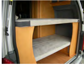
ベッドマットを外すと 1120×860mmの カーゴスペースに