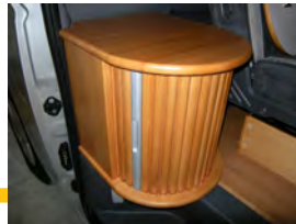
■シューズボックス