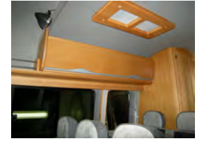
■ルーフキャビネット