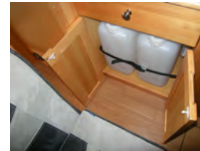
40L上蓋式冷蔵庫 20L清排水タンク を標準装備