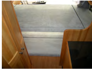
■リア2段ベッド 上：1840×900mm 下：1720×800mm