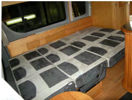
ひろびろフロアベッド (1880×1200mm)